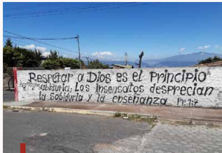
Bijbeltekst langs weg in Zuid-Amerika

De intensiteit van de bevrijdingsbeweging steeg naar een piek rond 1980 maar nam daarna af naarmate de democratie in de regio in de verschillende landen werd hersteld, en de schendingen van de fundamentele mensenrechten afnamen. Maar de armoede bleef, en blijft. Het is bekend dat